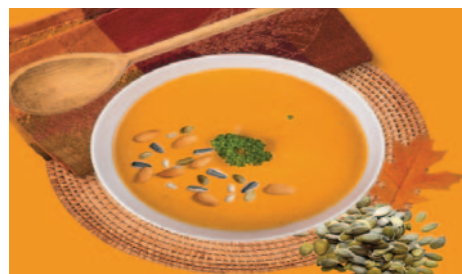
soupe de butternut aux graines de courges et gratin de brocolis

Déposer un peu de fromage râpé dans chaque champignon. Placer une boulette végétarienne par-dessus. Arroser d'un filet d'huile d'olive. Enfourner 15 à 20 minutes jusqu'à ce que le fromage soit fondu et que les boulettes soient bien dorées. Si le dessus dore trop vite, couvrir avec une feuille de papier d'aluminium.