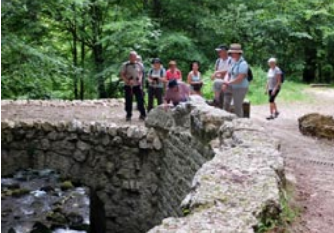
Marche à Vaire-Arcier